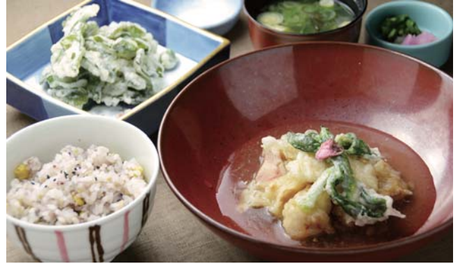
和膳 1085kcal 鶏天の生姜あんかけ・わかめ天婦羅・十六穀米・味噌汁・香物 ¥1,250