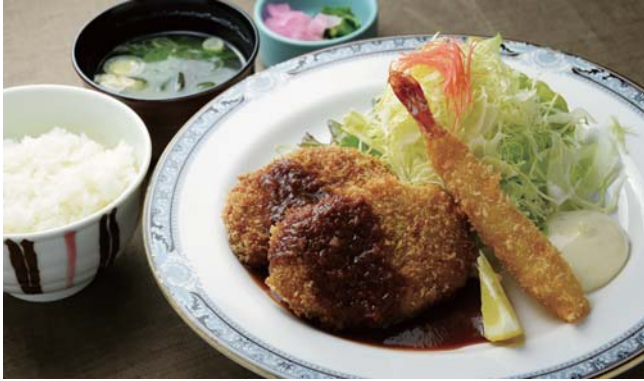
メンチカツ定食 947kcal メンチカツ・エビフライ・御飯・味噌汁・香物 ¥1,200

●表示はすべて税別価格です ●味付けのご要望や食物アレルギーのあるお客様はスタッフまでお知らせください