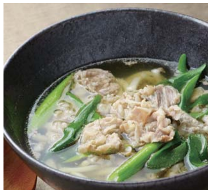
肉うどん 566kcal 国産牛使用。おそばに変更できます ¥1,100 ! おにぎりセット+¥200