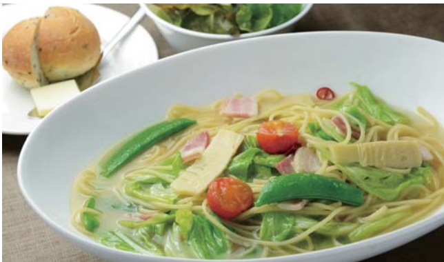
春野菜とベーコンのスープパスタ 968kcal スープパスタ・パン・サラダ ¥1,250