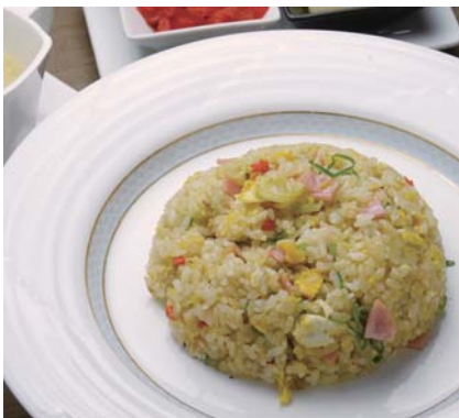
チャーハン 830kcal シャンタンスープ付 ¥1,000