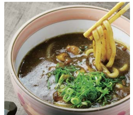
カレーうどん 812kcal おそばに変更できます ¥1,000 ! おにぎりセット+¥200