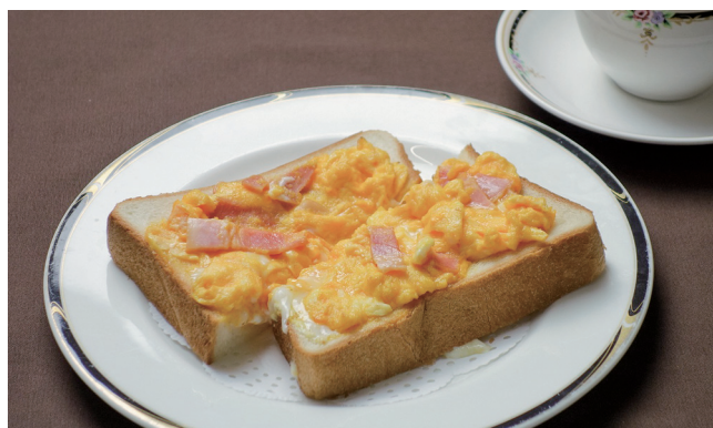
スクランブルエッグトースト 464kcal